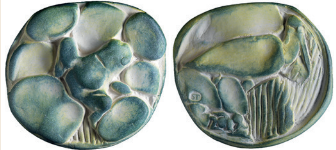
Nr. 6 en 6a. Kikker, 75 mm, terracotta, 2019 (37ste jaarpemning). Geer Steyn.

In de voortuin van Steyns atelier nestelde zich een kolonie hommels die lustig erop los vlogen op zoek naar stuifmeel en daardoor kon hij de wonderschone beestjes goed bestuderen (afb. 5). Op de keerzijde van zijn 36 ste jaarpemning staan bloemen en het jaartal (afb. 5a).