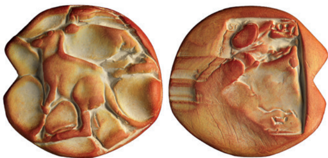
Nr. 8 en 8a. Kangoeroe, 75 mm, terracotta, 2021 (39ste jaarpenning). Geer Steyn.

Op de keerzijde schetste de medailleur met enkele lijnen rechtsonderaan een heel klein kangoeroetje die wegvlucht voor het helse vuur (afb. 8a).