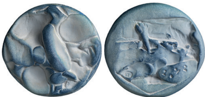
Nr. 9 en 9a. Aalscholver, 80 mm, terracotta, 2022 (40ste jaarpenning). Geer Steyn.

Op de keerzijde schetste de medailleur met enkele lijnen rechtsonderaan een heel klein kangoeroetje die wegvlucht voor het helse vuur (afb. 8a).