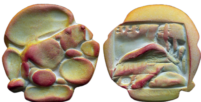
Nr. 10 en 10a. Bever, 70 mm, terracotta, 2023 (41ste jaarpenning). Geer Steyn.

Dichtbij het huis van Steyn zat een aalscholver met wijde vleugels te zonnen, dat is altijd een fascinerend gezicht (afb. 9). Op de keerzijde van zijn 40 ste jaarpenning staat het dier, dat als een pijl de zee in duikt (afb. 9a).