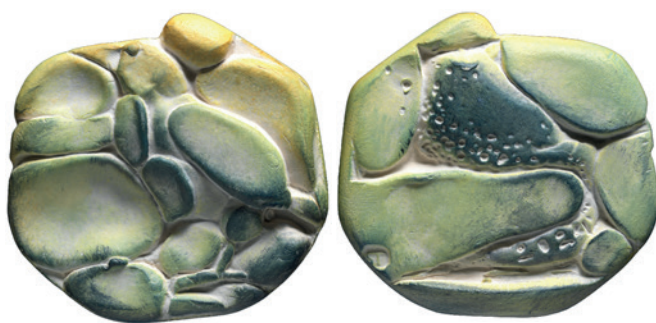
Nr. 11 en 11a. Spreeuw, 71 mm, terracotta, 2024 (42ste jaarpenning). Geer Steyn.

Tijdens zijn reis naar Noord Alaska ontmoette hij vele bevers die een tijdje, al klapperend met hun staart meezwommen naast zijn kano en dat werd het onderwerp voor zijn 41 ste jaarpenning (afb. 10). Op de keerzijde staat hun burcht half onder water (afb. 10a).