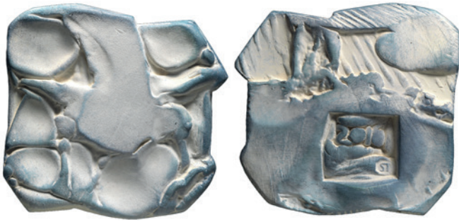
Nr. 3 en 3a. Meeuw, 85 mm, terracotta, 2016 (34ste jaarpemning). Geer Steyn.

De keerzijde toont een onstuimige zee waarin het jaartal en de naam van het museum staat (afb. 3a).