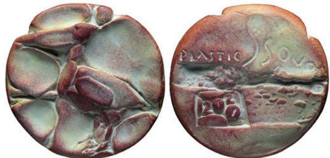
Nr. 7 en 7a. Pelikaan, 80 mm, terracotta, 2020 (38ste jaarpemning). Geer Steyn.

Een sterke compositie van een kikker midden op de beeldenaar, werd zijn 37 ste jaarpemning (afb. 6). Op de keerzijde zijn predator, de ooievaar (afb. 6a). Zelf zegt hij: 'Zolang de ooievaar op de ene zijde van de pemning staat, heeft de kikker kans van slagen om op de andere kant in leven te blijven.'