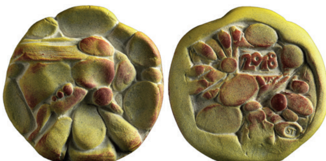
Nr. 5 en 5a. Hommel, 80 mm, terracotta, 2018 (36ste jaarpemning). Geer Steyn.

Tijdens een verblijf in de Provence werd Steyn en zijn vrienden in 2016 geconfronteerd met een mierenplaag. Zij marcheerden in groten getale door het huis. De mier staat op de voorzijde van zijn 35 ste jaarpemning en is zeer goed getroffen (afb. 4). Een gangenstelsel met mieren staat op de keerzijde (afb. 4a). Eens lag ik te zonnen met mijn oor op de grond, toen ik gekrijs hoorde. Opgericht was het geluid weg, maar zag niemand in de omgeving. Handdoek opgetild en zag daar een gekrioel van mieren, dat die zo'n lawaai maakten, daar had ik geen weet van. Het deed mij aan een verhaal van een heilige denken, die stil voor een muur zat te mediteren waarop zijn leerlingen vroegen waarom hij naar een muur keek. Waarop hij zei; 'Ik luister naar het gekrijs van de mieren.'