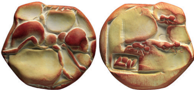
Nr. 4 en 4a. Mier, 75 mm, terracotta, 2017 (35ste jaarpemning). Geer Steyn.

De keerzijde toont een onstuimige zee waarin het jaartal en de naam van het museum staat (afb. 3a).